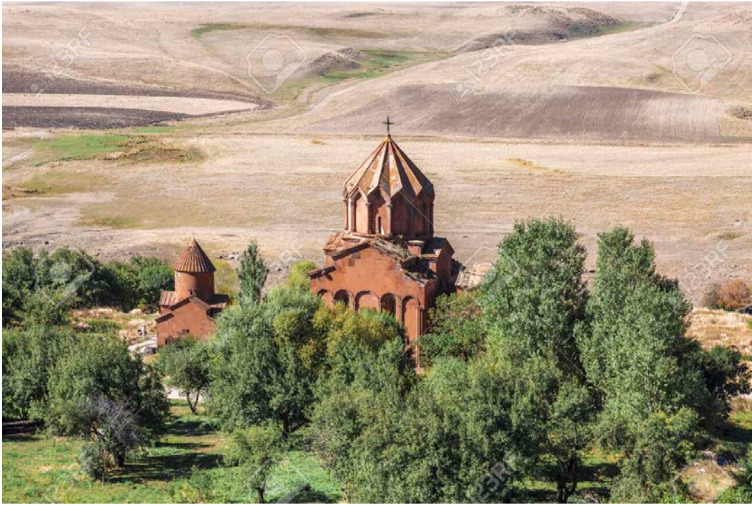
Мармашенский монастырь в Армении, расположенный в Ширакской области