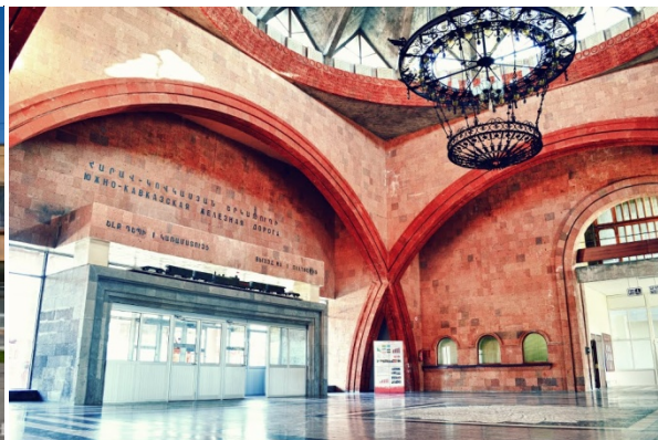
Железнодорожная станция Гюмри