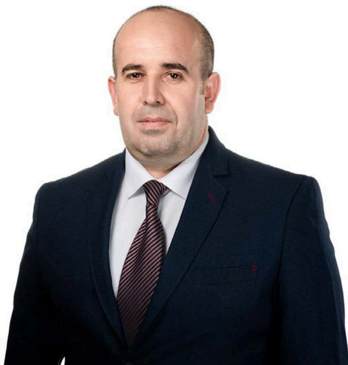
Тигран Петросян: губернатор Ширакской области