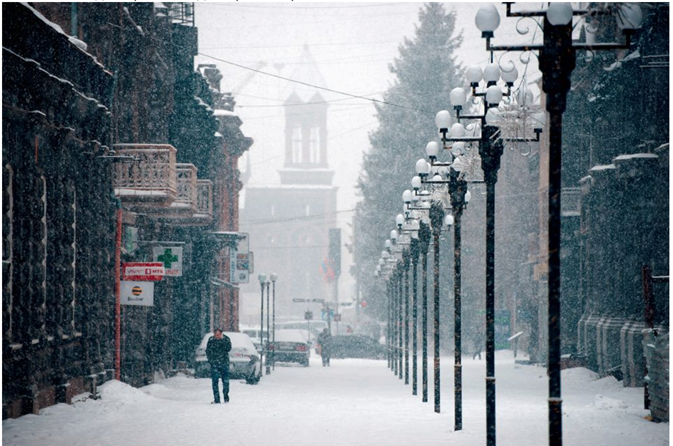
Гюмри в январе

Климат широко соответствует средневропейским погодным условиям. Холодно, влажно, и несколько прекрасных летних месяцев также происходят в течение года. Из-за более высоких температур лучшее время для путешествий - с мая по сентябрь. Зимние спортсмены найдут свои любимые погодные условия с декабря по март.